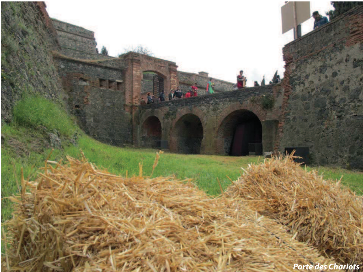
Porte des Chariots

Autres activités sur demande : visites théâtralisées et location d'espaces.