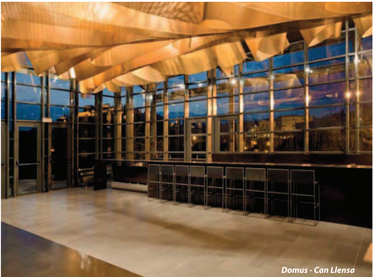
Domus - Can Llena

Le bâtiment offre un large éventail de possibilités culturelles (expositions), touristiques (information et visites) et gastronomiques (ateliers de cuisine et dégustations).